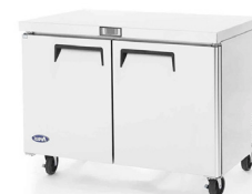
Refrigeradores Bajo Cubierta (MGF8402)