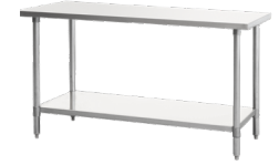
Mesa de Trabajo (MRTW-2436)