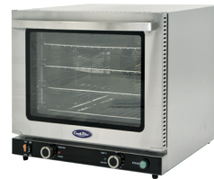
Hornos de Convección (CRCC50-S)