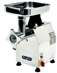
Trituradores de Carne (PPG-22)