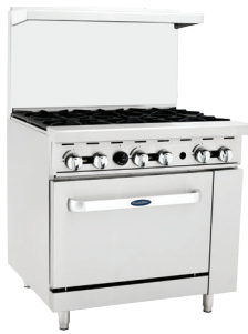
Estufas de Gas (ATO-6B)