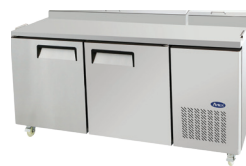
Mesas para Preparación de Pizza (MPF8202)