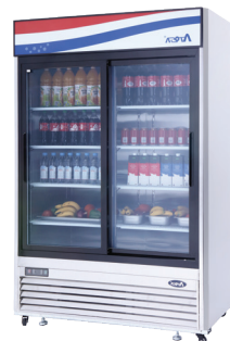
Refrigerador de 2 puertas Deslizantes de Vidrio con luz de Montaje Inferior (MCF8709)