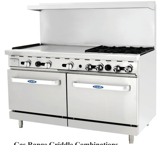
Gas Range Griddle Combinations (ATO-4B36G)