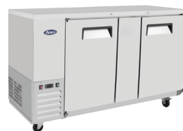
Enfriador para Barra trasera (MBB69)