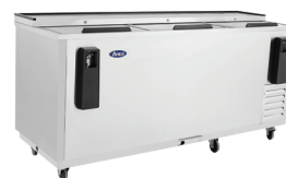
Enfriadores para Barra (MBC80)