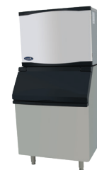
Máquinas Fabricadoras de Hielo (YR800-AP-161)