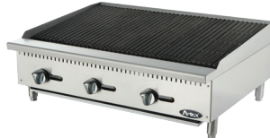
Asadores Radiantes (ATRC-36)