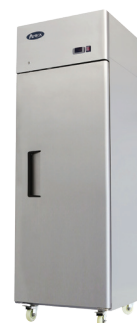
Accesos Directos de Montaje Superior (MBF8001)