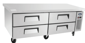
Base para Chef (MGF8453)