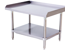
Soporte para Equipo de Acero Inoxidable (ATSE-2836)