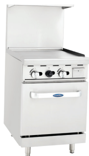
Parrillas de Estufa de Gas (ATO-24G)