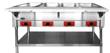
Mesas de Vapor (CSTE4-4 / CSTEB-4)

Hay otros modelos de cada serie disponibles. Por favor, consulte Autoquotes o nuestro sitio web para ver el espectro completo de productos: www.atosausa.com