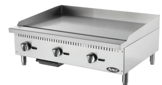
Planchas Manuales (ATMG-36 HD 36)