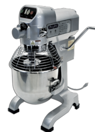
Batidoras Planetarias (PPM-20)

Hay otros modelos de cada serie disponibles. Por favor, consulte Autoquotes o nuestro sitio web para ver el espectro completo de productos: www.atosausa.com