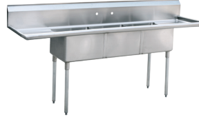
Fregaderos de Tres Compartimientos de acero Inoxidable (MRSB-3-D)