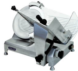
Rebanadores de Carne (PPSL-14)