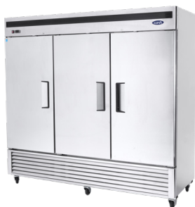
Refrigeradores de Montaje Inferior (MBF8508)