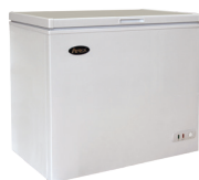
Congeladores Horizontales con Cubierta Sólida (MWF-9016)