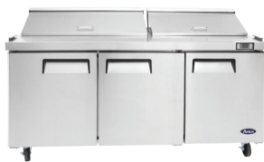
Mesas para Preparación de Sándwiches (MSF8304)