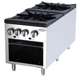
Estufas para Ollas (ATSP-18-2L)