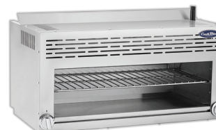
Fundidores de Queso (ATCM-36)