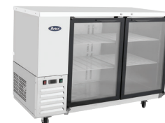
Enfriadores para Barra Trasera (MBB59-G)