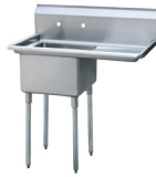
Fregadero de un Compartimiento de Acero Inoxidable (MRSA-1-R)