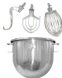
Accesorios para Batidoras