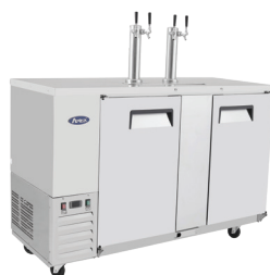
Enfriadores de Barril (MKC58)