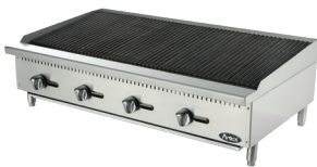
Asadores de Roca de Carbón (ATCB-48)