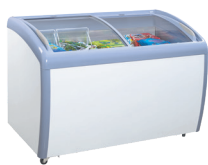
Congelador Horizontal con Tapa de Vidrio en Arco (MWF-9112)