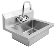
Fregaderos para Lavado de Manos (MRS-HS-18)